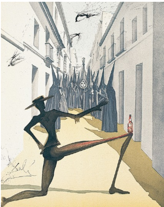
サルバドール・ダリ《カルメン》1970年 カラーリトグラフ・紙 64.0x49.5cm 公益財団法人諸橋近代美術館蔵 ©Salvador Dalí, Fundació Gala-Salvador Dalí, JASPAR Tokyo, 2017 E2700