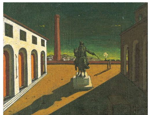
ジョルジオ・デ・キリコ《イタリア広場》1914年 油彩・キャンバス 41.0×51.4cm 公益財団法人諸橋近代美術館蔵 ©SIAE, Roma & JASPAR, Tokyo, 2017 E2700

©Salvador Dalí, Fundació Gala-Salvador Dalí, JASPAR Tokyo, 2017 E2700