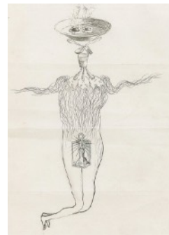
サルバドール・ダリ ヴァランティヌ・ユゴー ガラ・エリュアール アンドレ・ブルトン 《甘美な死骸》1934年 ペン・インク・鉛筆・紙 26.7×19.5cm 公益財団法人諸橋近代美術館蔵

今回のコレクション展では当館所蔵の西洋近代及びダリコレクションを通して、シュルレアリスムの発端と展開をご紹介します。