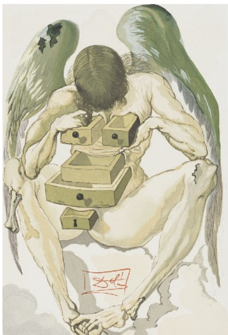
サルバドール・ダリ《ダンテ『神曲』煉獄篇》1960-63年頃 リトグラフ・着色木版・紙 33.0x26.0cm 公益財団法人諸橋近代美術館蔵 ©Salvador Dalí, Fundació Gala-Salvador Dalí, JASPAR Tokyo, 2017 E2700