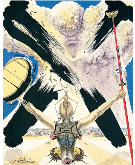
サルバドール・ダリ《ドン・キホーテ(原子力時代)》1957年 カラーリトグラフ・紙 41.0x33.0cm 公益財団法人諸橋近代美術館蔵 ©Salvador Dalí, Fundació Gala-Salvador Dalí, JASPAR Tokyo, 2017 E2700

テーマ1では、風車を巨人と思い込んで突撃してしまう狂人的な主人公ドン・キホーテの物語を、「銃弾主義」によって表現した挿絵版画全12点をご紹介します。