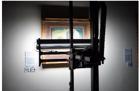
最新のスキャン技術により、筆致まで生々しく再現された高品質な複製画