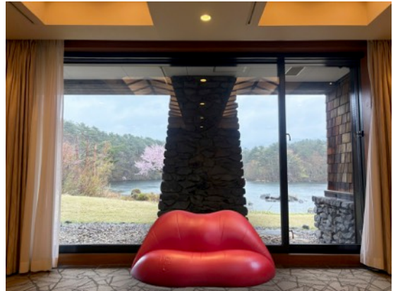
リップソファを設置した展示スペースイメージ

本プロジェクトは、美術館の「冬眠（休館）」中も、皆様の「日々」のすぐそばに「モロビ（諸橋近代美術館）」が存在し続けたいという想いから誕生しました。第1弾の病院での展示に続き、今回は美術館の地元・裏磐梯を代表する「裏磐梯高原ホテル」を舞台に、よりプライベートな鑑賞体験を提案します。