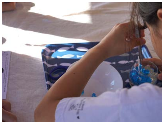
キャンドルやベアアート、ミニチュアフードなど様々なワークショップ実施（有料）！おきにいり見つけて参加しよう