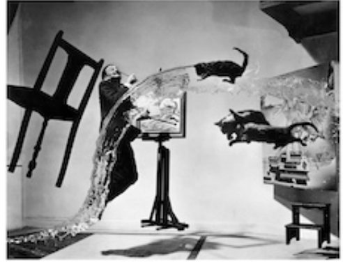
フィリップ・ハルスマン《ダリ・アトミクス》1948