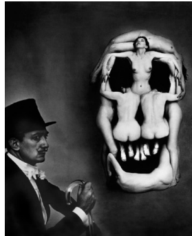
フィリップ・ハルスマン 《官能的な死》1951 公益財団法人諸橋近代美術館 Photo by Philippe Halsman © The Philippe Halsman Archive