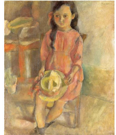
ジュール・パスキン 《帽子を持つ少女》1924 公益財団法人諸橋近代美術館