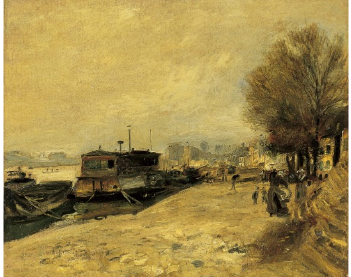
ピエール=オーギュスト・ルノワール 《パリ郊外、セーヌ河の洗濯船》1872-1873 公益財団法人諸橋近代美術館

18世紀後半から19世紀のヨーロッパ社会は激動の転換期。政治や経済産業だけでなく、美術の領域でも近代化における革命が起きていました。近代美術における様式の革新と変貌、美の多様性の変遷を取り上げ、当時の社会情勢が作品にどのような影響を与えたのかを探っていきます。