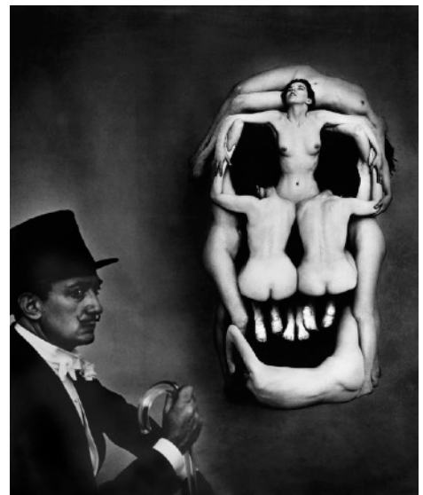
フィリップ・ハルスマン 《官能的な死》1951 公益財団法人諸橋近代美術館 Photo by Philippe Halsman © The Philippe Halsman Archive

「技法」という切り口から、作品がどのようにして制作されたのか、どのような技法や素材が使われているのかを解説します。制作過程を通して、技術的な理解を深めながら、また一方で、作品を物質としてみるといった新たな視点で作品をお楽しみください。