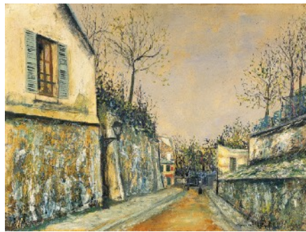
モーリス・ユトリロ 《モンマルトルのソル通り》1914 公益財団法人諸橋近代美術館