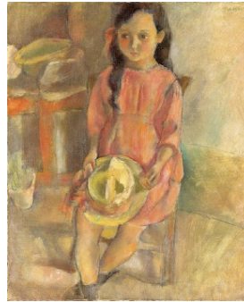
ジュール・パスキン 《帽子を持つ少女》1924 公益財団法人諸橋近代美術館