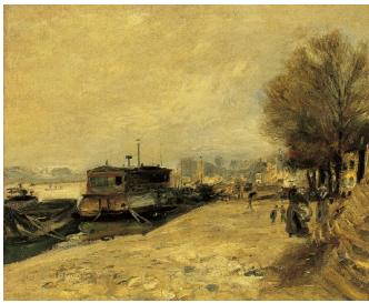
ピエール=オーギュスト・ルノワール 《パリ郊外、セーヌ河の洗濯船》1872-1873 公益財団法人諸橋近代美術館