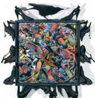
PJ クルック《ステッピング・アウト》 2017年 諸橋近代美術館蔵 ©PJ Crook 2021