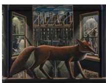
PJ クルック《きつね》 2015年 諸橋近代美術館蔵 ©PJ Crook 2021