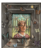
PJ クルック《メタモルフォーゼ》 2018年 諸橋近代美術館蔵 ©PJ Crook 2021