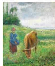
カミーユ・ピサロ 《ポントワーズ丘陵、牛飼いの少女》 1882年 公益財団法人諸橋近代美術館蔵