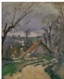
ポール・セザンヌ 《オーヴェール=シュル=オワーズの蕨葺きの家》 1872-73年 ポーラ美術館蔵