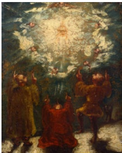
ポール・セザンヌ《宗教的な場面》1860-62年 ポーラ美術館蔵