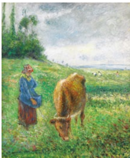
カミーユ・ピサロ《ポントワーズ丘陵、牛飼いの少女》1882年 公益財団法人諸橋近代美術館所蔵

セザンヌといえば「林檎の静物画やサント=ヴィクトワール山を主題とした作品を制作した画家」とイメージする人が多いのではないのでしょうか。これらのイメージは、セザンヌの絵画様式が確立された後年の作品からくるものです。本展では、普段はあまりスポットが当てられないことがないセザンヌの初期に注目し、画家の人柄や挑戦と挫折を繰り返した画業を紹介します。