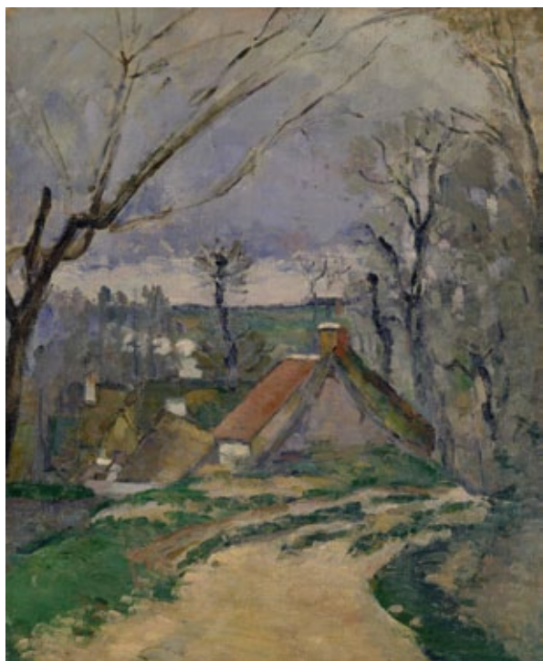
ポール・セザンヌ《オーヴェール=シュル=オワーズの蕈茸きの家》 1872-73年 ポーラ美術館蔵