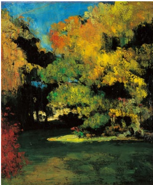
ポール・セザンヌ《林間の空地》 1867年 公益財団法人諸橋近代美術館所蔵