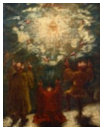
ポール・セザンヌ 《宗教的な場面》 1860-62年 ポーラ美術館蔵