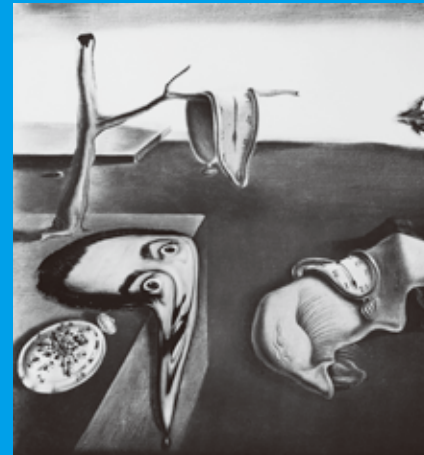
《シュルレアリスムとは、私自身だ》1954年