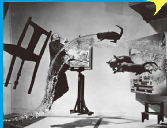
《ダリ・アトムクス》1948年