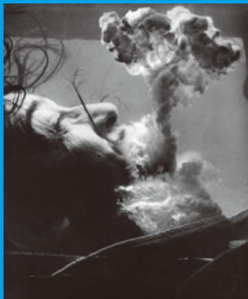
《私は原子爆発に思いふける》1954年