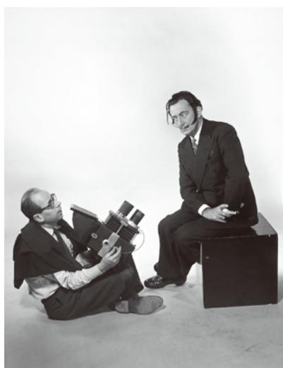
《インタビュー》 The Interview, 1954

諸橋近代美術館では2020年4月25日から9月6日まで開館20周年記念展vol.3「ダリとハルスマン」を開催します。2019年よりつづく開館20周年記念展を締めくくる本展覧会は、作品を海外から借用しての当館初の写真展です。