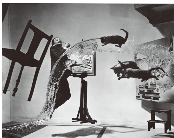
《ダリ・アトミクス》 Dalí Atomicus, 1948