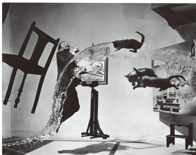
《ダリ・アトミクス》 Dalí Atomicus, 1948