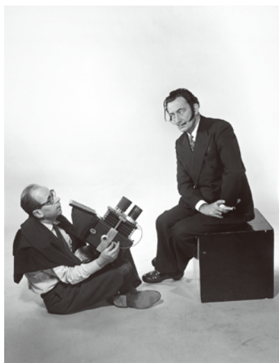
《インタビュー》 The Interview, 1954

諸橋近代美術館では2020年4月25日から9月6日まで開館20周年記念展vol.3「ダリとハルスマン」を開催します。2019年よりつづく開館20周年記念展を締めくくる本展覧会は、作品を海外から借用しての当館初の写真展です。