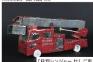
「日野レンジャー はしご車」