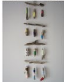
「れいこいなわしろ流木モビール」