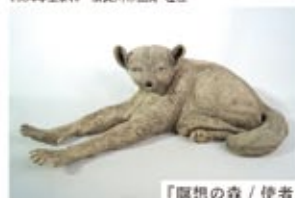
「願想の森 / 使者」